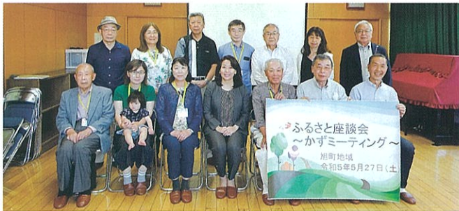
5/27、旭町近隣センターで行われたかずミーティング（前列中央に太田和美市長）

まず、基本情報として、この地域はJR柏駅西口を中心とした住宅地と商業地域であり、駅の近くはマンション群、少し遠くに行くと一戸建て住宅や社宅などで構成されていることを説明しました。